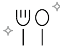
トレー・カトラリーのアルコール消毒 Alcohol Sterilization of Tray and Cutlery